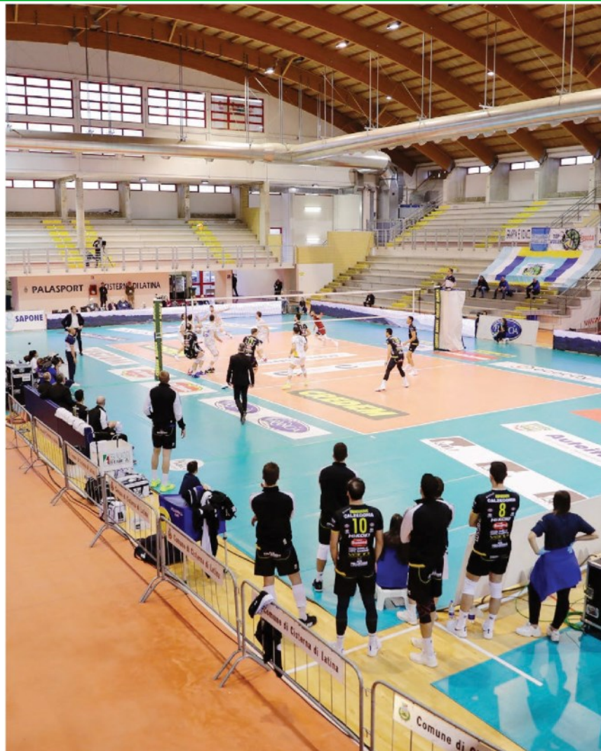
Il palazzetto deserto di Latina nel quale s'è giocata Cisterna-Verona (LIVERANI)