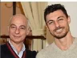
Via degli Orti 19, Trento